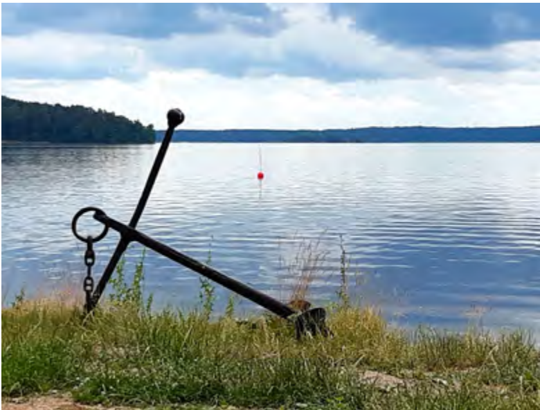
Stiltje över Ekoln.

Avsändare: Svenska Kryssarklubben Uppsala-Roslagskretsen c/o Bo Nordlund Orphei Drängars Plats 5 75311 UPPSALA