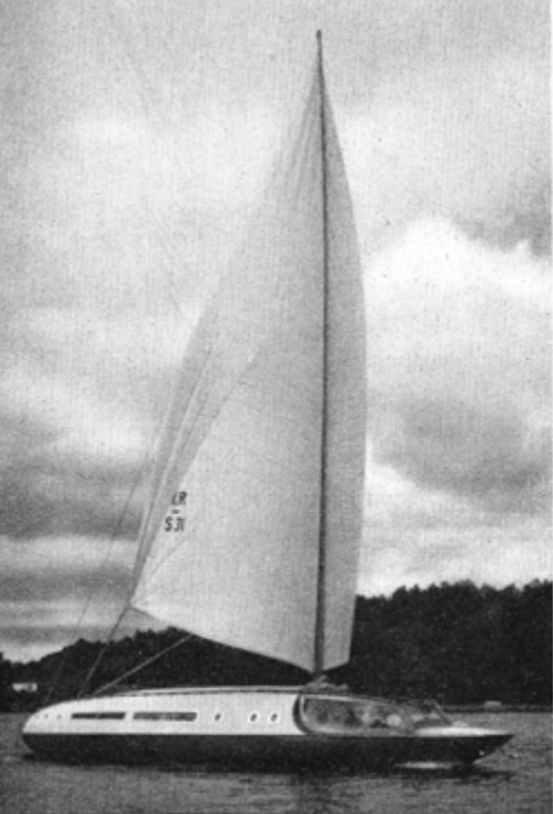
Stenbecksbåten Tesla på läns.