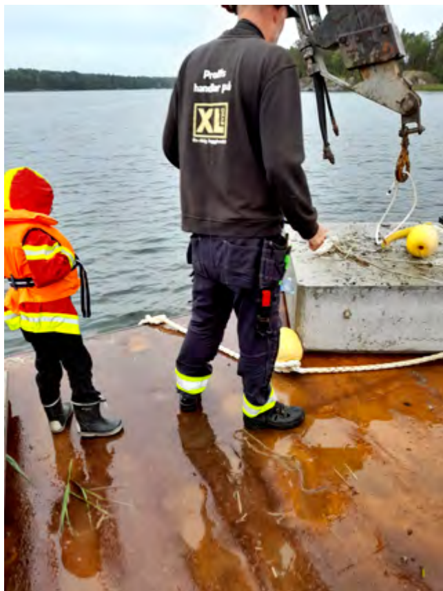
Utläggning av bojsten.