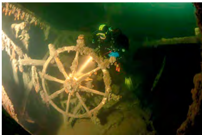
Efter 38 år kunde vraket efter Nedjan lokaliseras.